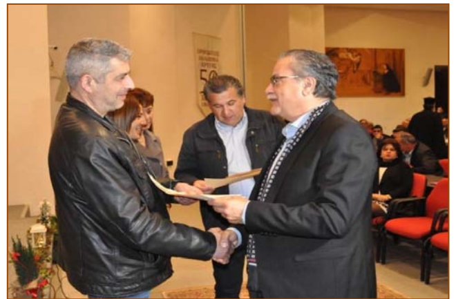
Υποδοχή του Νέου Έτους (βλπ. 2603)