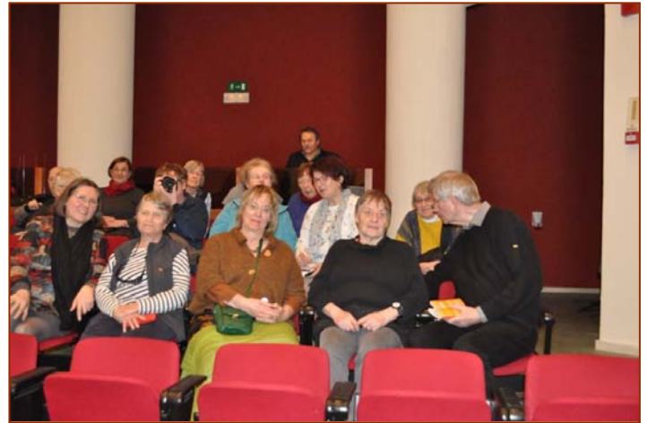
Ομάδα από τη Γερμανία (βλπ. 2621)