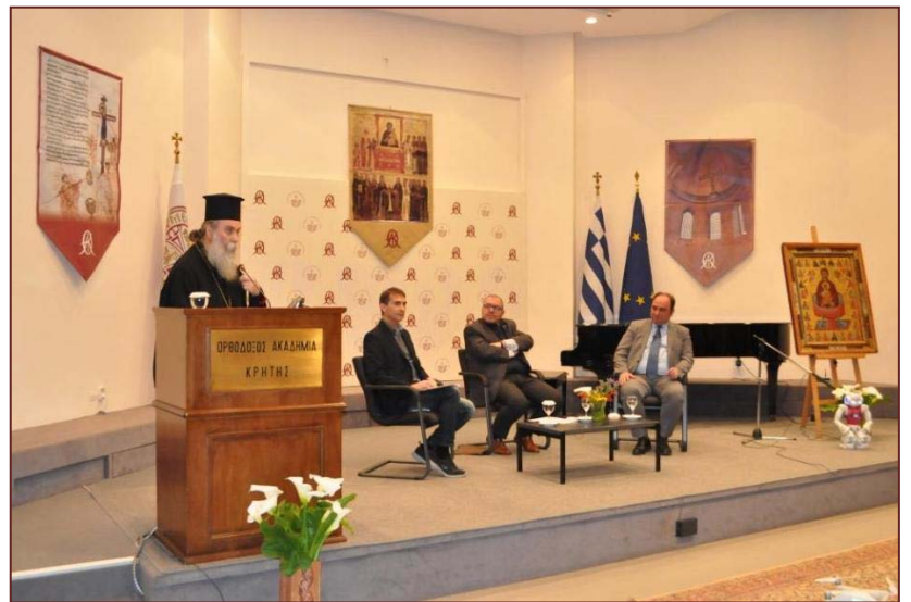
Κυριακή της Ορθοδοξίας (βλπ. 2622)