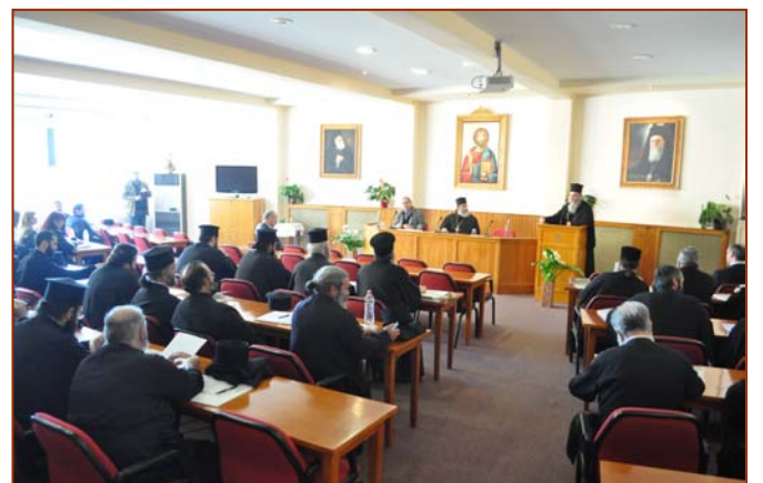
Παγκρήτιο Ιερατικό Σεμινάριο (βλπ. 2618)