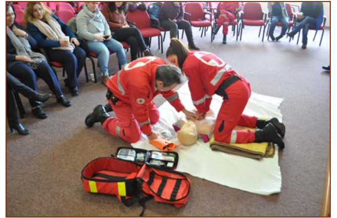
Σεμινάριο Ζωής (βλπ. 2613)