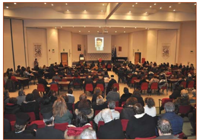
Ο Όσιος Ιάκωβος όπως τον γνώρισα (βλπ. 2614)