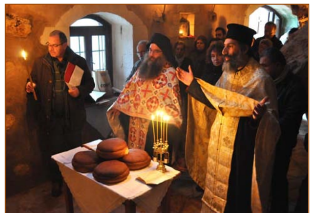
Εσπερινός Αγίου Μακαρίου (βλπ. 2605)