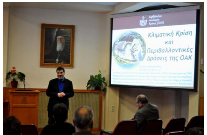
Κλιματική Αλλαγή και Εκπαίδευση (βλπ. 2610)