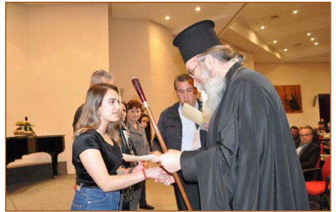
Υποδοχή του Νέου Έτους (βλπ. 2603)