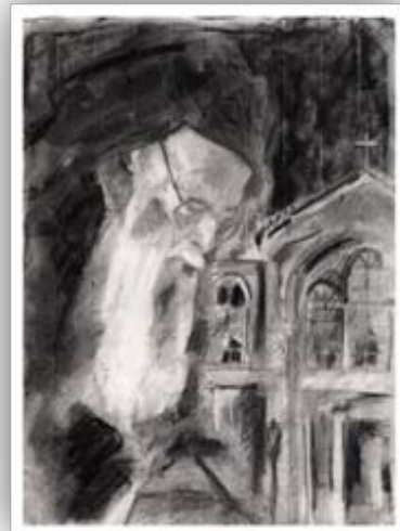
«Ο Πατριάρχης στη Χάλκη» Έργο της Εσθήρ Λέμη για την παραγωγή «Το Τετράδιο του Πατριάρχη»

Στον αγώνα αυτόν, οι συντεταγμένες πολιτείες, τα κράτη και οι αρμόδιες υγειονομικές Αρχές, έχουν την κυρίαρχη ευθύνη για τον σχεδιασμό, την ορθή αντιμετώπιση και την υπέρβαση αυτής της κρίσης. Θα