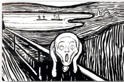
Η άηχη «Κραυγή» (Νορβηγικά: Skrik), έργο του Νορβηγού Edvard Munch.

Όπως και να έχει, ζούμε κάτι ιστορικό και μοναδικό. Το ερώτημα είναι τί θα απομείνει από όλα αυτά, όταν ο ιός θα έχει κάνει τον κύκλο του; Θα επιστρέψουμε στα παλιά; Ή θα οδηγηθούμε σε μία νέα ιογενή πραγματικότητα; Επειδή όλα όσα κάνουμε και αποφασίζουμε σήμερα θα έχουν αποτέλεσμα και αντίκτυπο στα επόμενα χρόνια. Το μέλλον μας αποφασίζεται τώρα. Εδώ και τώρα!