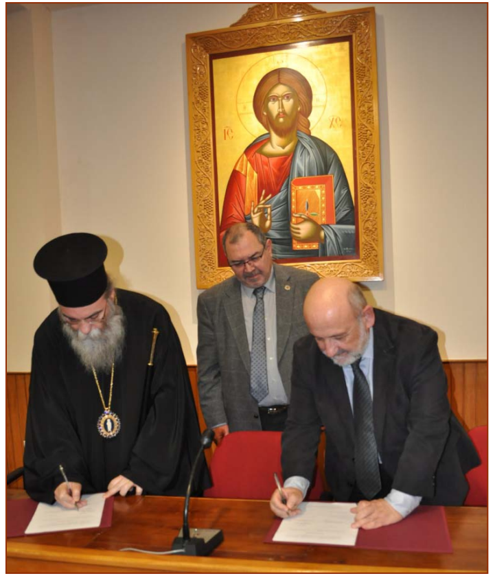
Παιδεία και Τεχνητή Νοημοσύνη (βλπ. 2608)