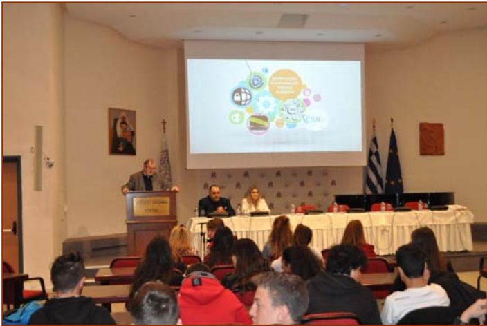
Ημερίδα για την Κυβερνοασφάλεια (βλπ. 2619)